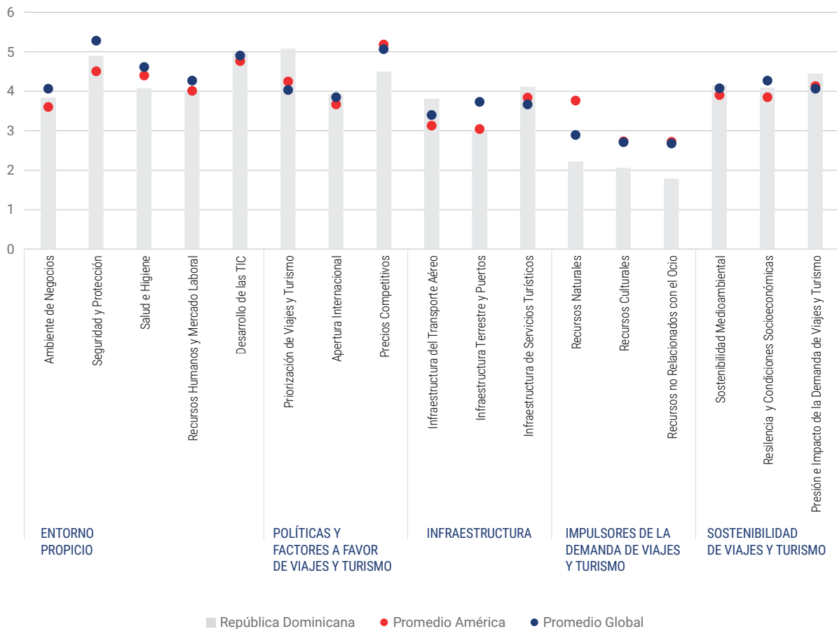
GRÁFICO 3. Índice de Desarrollo de Viajes y Turismo Región 2021 (Comparación por pilares entre RD, Promedio Regional y Mundial)